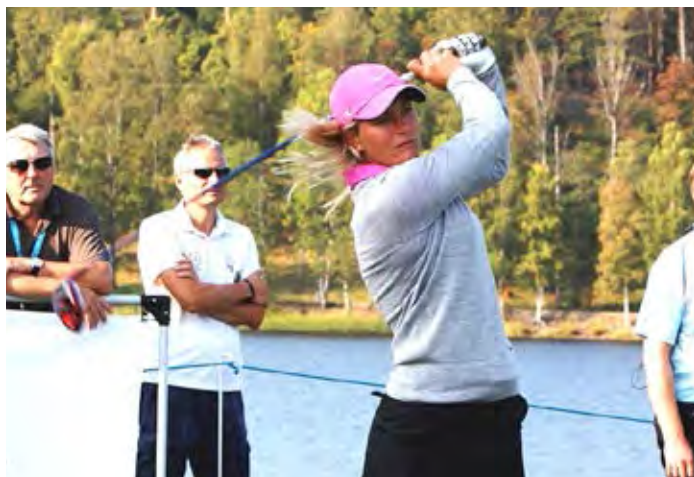
Bilde er tatt under Suzann Pro Challenge i 2013.