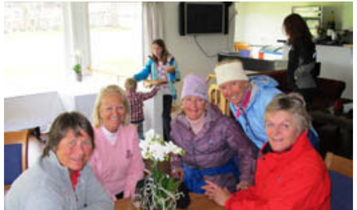
Glade bidragsyttere på årets dugnad.