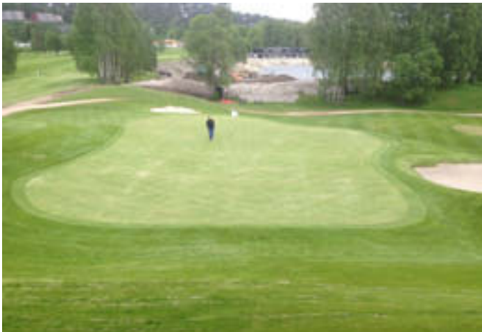
Green 8 ble etter omfattende arbeid åpnet for spill 1. juni.

Mange er flinke men vi registrerer fortsatt at det gjøres for lite med hensyn til å ta vare på vår egen bane. Nedslagsmerker må repareres og divots må legges ordentlig tilbake. Det vil si at man må bruke helen til å trykke torven ordentlig på plass slik at det blir ordentlig jordkontakt.