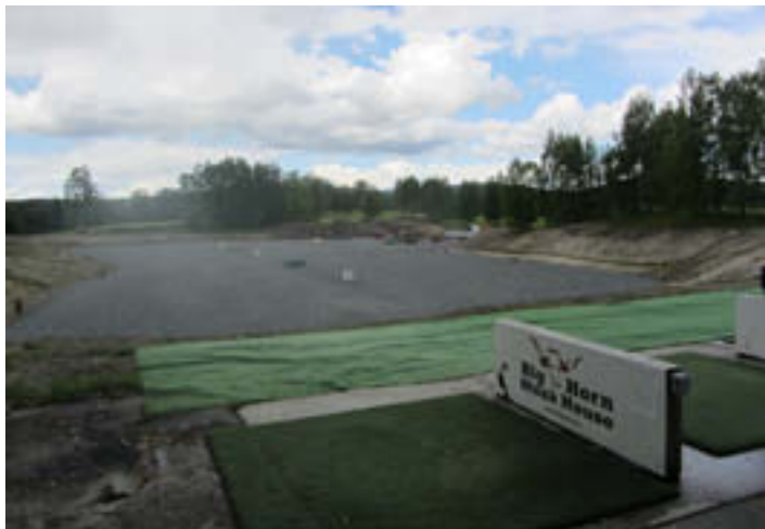
Drivingrangen er kanskje ikke så fin, men fullt spillbar.

Drivingrangen, på det nåværende tidspunkt, ser kanskje ikke så bra ut, men den fungerer. Bandyfolket avslutter i disse dager arbeidet for denne gang. Det har vært mye styr, spesielt med massedepoiet mellom hull 11 og 12. Vi jobber fortsatt med å finne en permanent løsning på dette. Dersom de innvilgede penger til mer investering i kunstisbaneprojektet blir frigjort i tide vil fase 2 av prosjektet starte til høsten. Dato for oppstart er ikke avtalt. Vi vil informere på nettsiden når noe er bestemt.