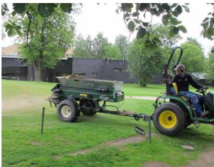
Baneavdelingen i full sving med sanddressing tirsdag 28. juni.

Ukene med rehabilitering av vinterskader går systematisk videre. Det legges ned store resurser i jakten på å etablere et fullverdig spilleunderlag.